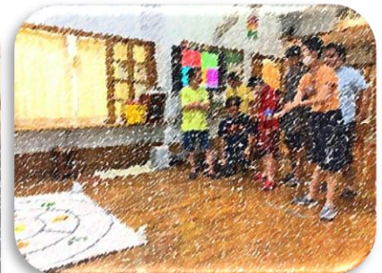
仲間を応援する声も飛び交っていました!