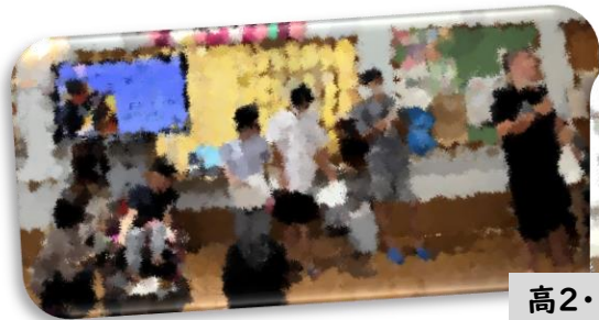
高2・3生の頼もしい発表!