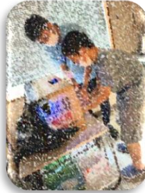
苦手箇所が確認できました!