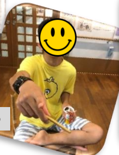
乾杯をして みんなで おやつ