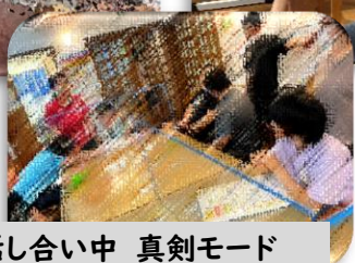
役割分担の話し合い中 真剣モード